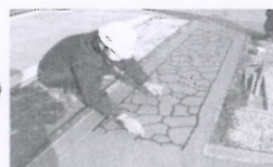
③ゴム型枠埋め込み