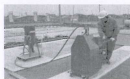
④サンドブラスト処理