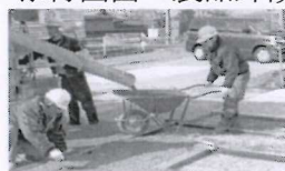
①生コンクリート投入