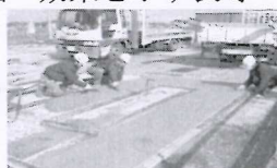
②表面金コテ仕上げ