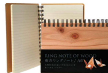
樹のリングノート