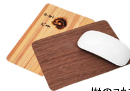
樹のマウスパッド