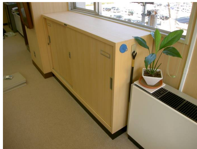
徳島県 障害者就労支援施設 杉間伐材・桧材