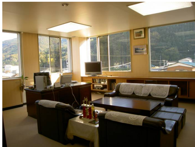
徳島県 市庁舎 桧材