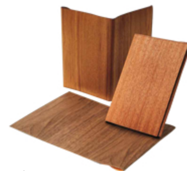
樹のブックカバー