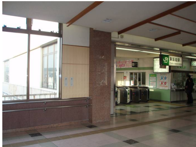
埼玉県 JR駅内 埼玉県産桧材