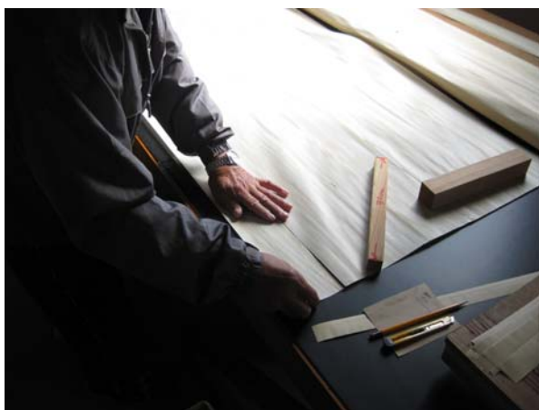
シート化(※製造特許取得済み)