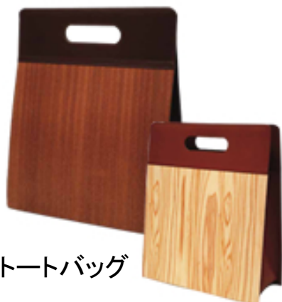
樹のトートバッグ