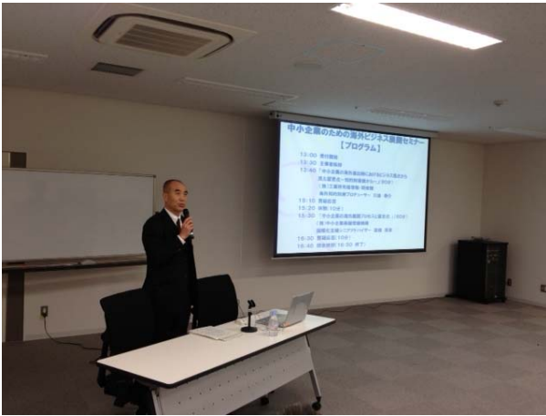
【川島PD講演(東京会場)】