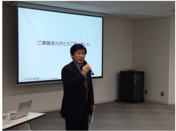
【高橋ADご講演(東京会場)】