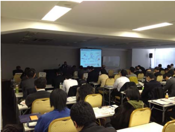
【川島PD講演(東京会場)】