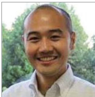
ファシリテーター： 一般社団法人 発明推進協会 研究員

1989年神戸大学工学部卒業後、三菱電機にて開発・設計・企画営業に従事、2000年から中国上海の現地法人にて技術提携、ライセンス契約等の業務を行う。2003年より小倉知財弁理士事務所を開設、弁理士業務と共に神戸大学等で知的財産アドバイザー等を歴任した。日本弁理士会では貿易円滑化対策委員会委員などの活動を行っている。2008年より特許業務法人グローバル知財を設立、代表弁理士に就任し、中小企業の企画・開発した商品／サービスをグローバルな視点で保護し活用すべく、その知財戦略、知財人材育成のサポートにあたっている。