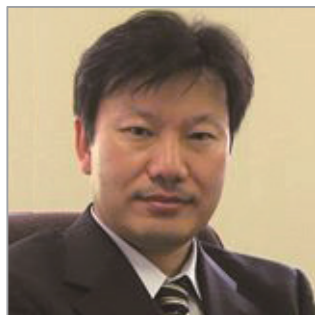
講師： 特許業務法人 グローバル知財 代表弁理士

経験豊富な講師陣との教材を活用したインタラクティブな進行により事業に生きる知財マネジメントの手法について深く掘り下げていきます。