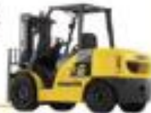
HST(油圧駆動式) フォークリフト