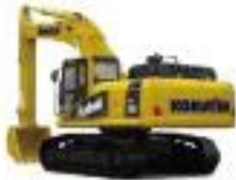
ハイブリッド 油圧ショベル