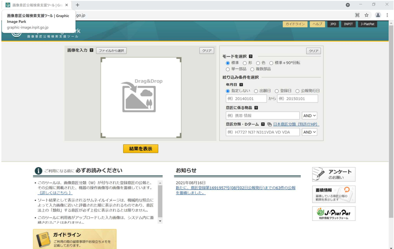
図3. 画像意匠公報検索支援ツールトップページ

画像意匠公報検索支援ツール： https://www.graphic-image.inpit.go.jp/