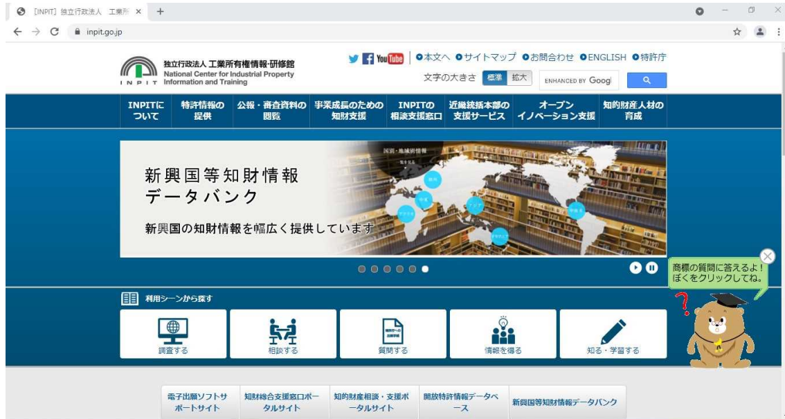
図 1. INPIT トップページ

J-PlatPat ( https://www.inpit.go.jp/j-platpat_info/index.html )から