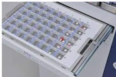
手撒きカセット (湯山製作所)