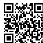
令和4年度表彰式 (YouTube動画にリンク)

インピットでは、ワークショップ参加後も発明の疑問にオンライン相談会でお答えします！お気軽にご相談ください！