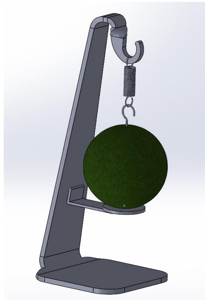
作品名：苔玉スタンド