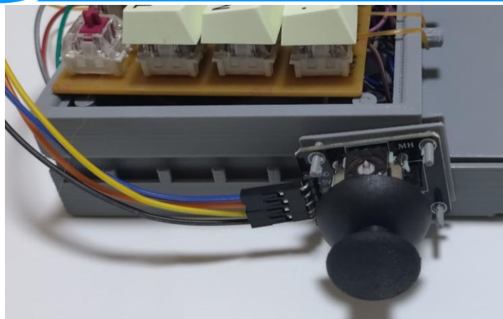
個人の手の大きさに合うように 3Dスティックスライド可能