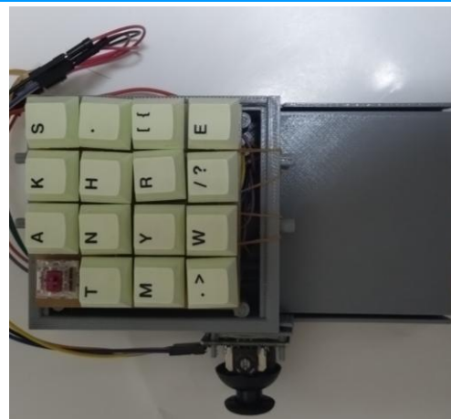
3Dスティックを両側面に取り付けられる ため両利き対応