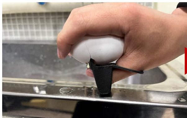
③衝撃を加えヒビを入れる