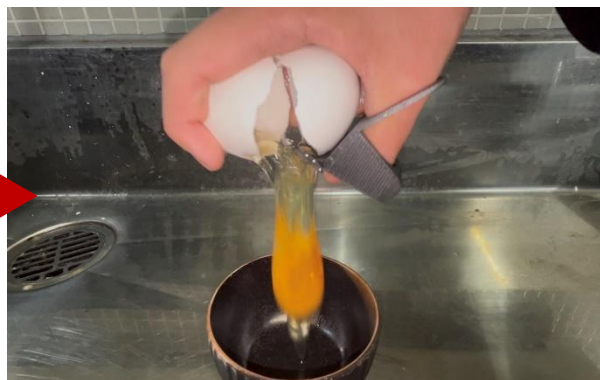
④殻を引っかけて割る