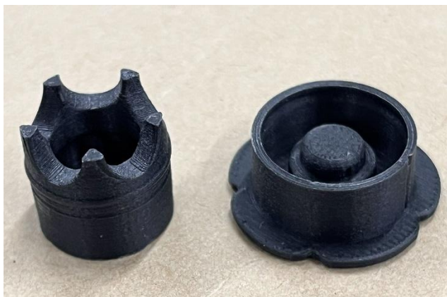
キャップは花形形状