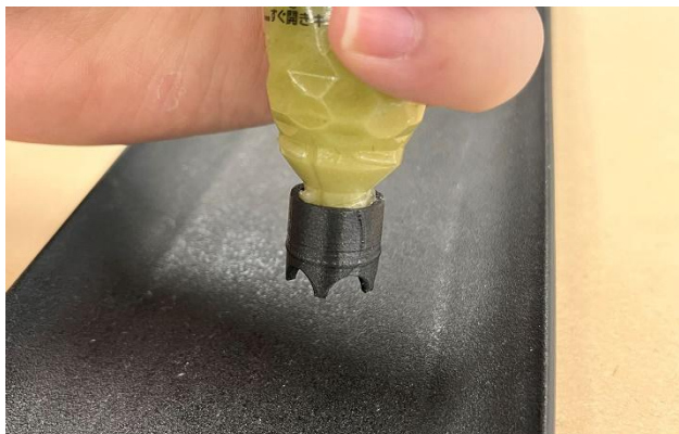
チューブ調味料に取り付け