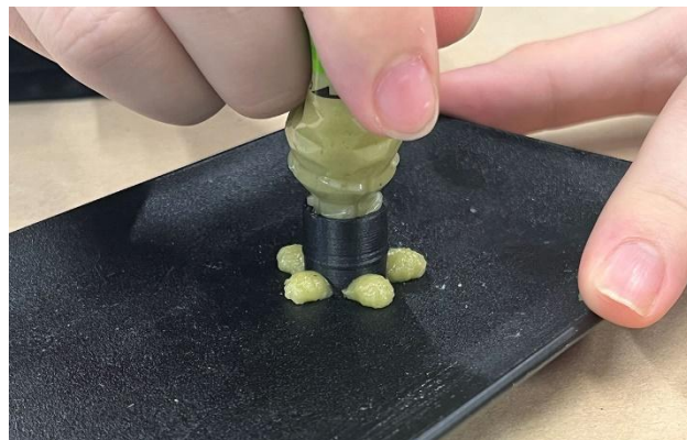
皿に押し付け押しすと