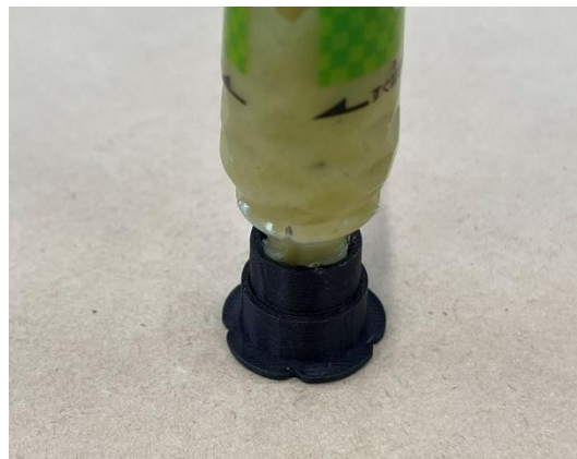
安定して立てられる