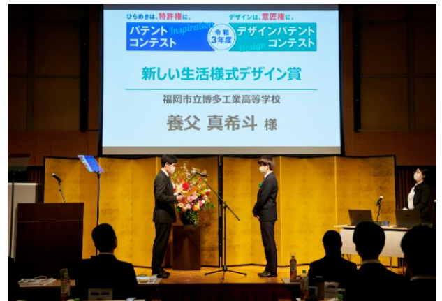
賞状授与 (新しい生活様式デザイン賞)