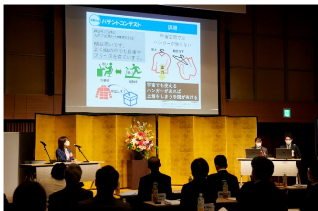
プレゼンテーション (パテントコンテスト選考委員長特別賞)