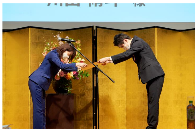
賞状授与 (デザインパテントコンテスト選考委員長特別賞)