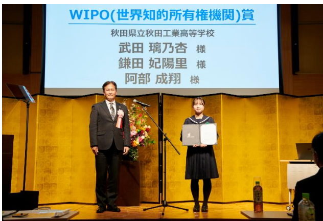
賞状授与 (WIPO(世界知的所有権機関)賞)