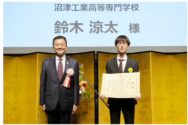
賞状授与（特許庁長官賞）