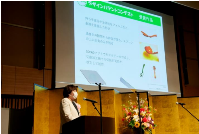
来賓による講評（日本弁理士会 会長賞）