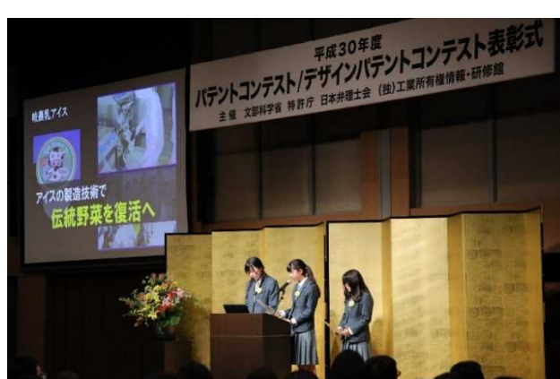
プレゼンテーション (平成30年度特許庁長官賞)