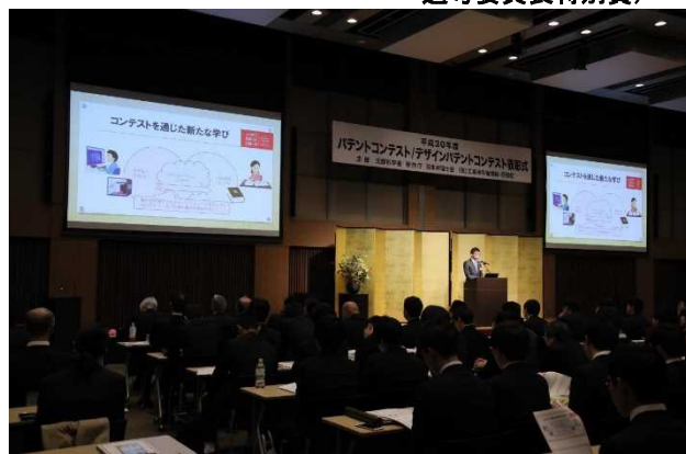
プレゼンテーション (平成30年度文部科学省 科学技術・学術政策局長賞)