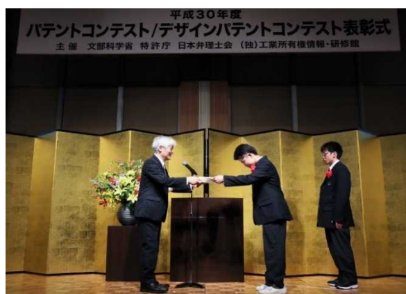
賞状授与 (独立行政法人工業所有権情報・研修館 理事長賞)