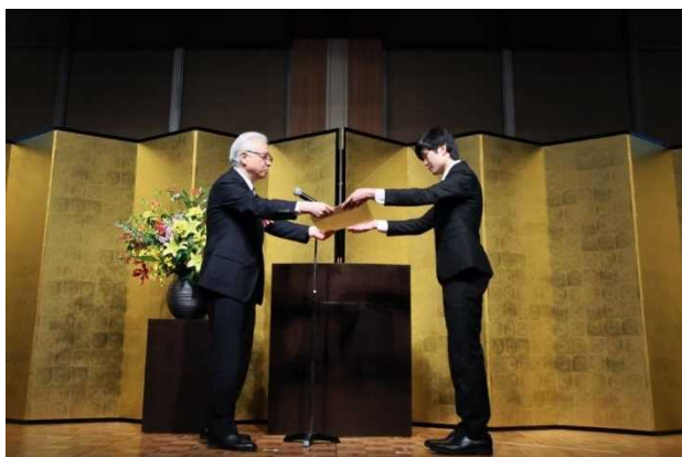
賞状授与 (日本弁理士会 会長賞)