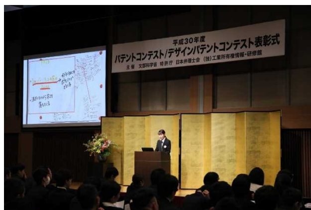
プレゼンテーション (平成30年度デザインパテントコンテスト 選考委員長特別賞)